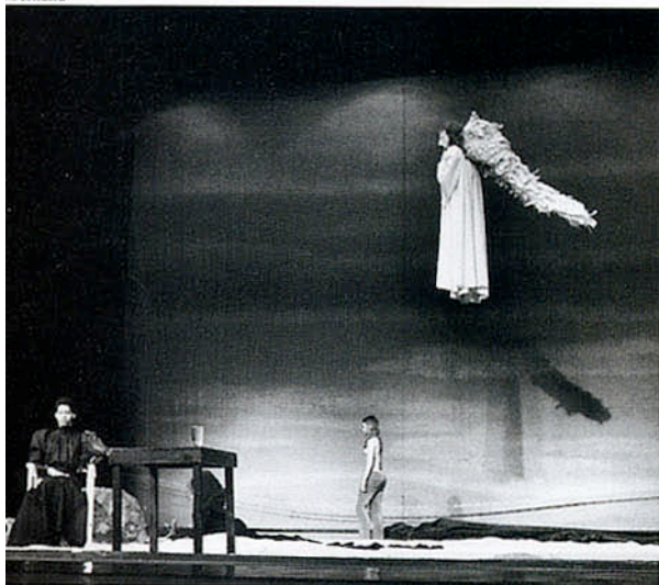
Regard du sourd , mis en scène par Bob Wilson en 1971.